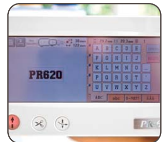
Einprogrammierte Schriften mit Tastenfeld