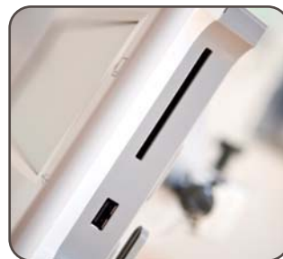
USB-Port und Karten-Slot